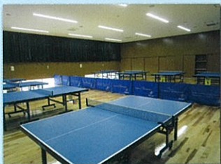
1F 小体育室 卓球台を個人利用に常時設置しています。