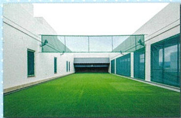
3F 弓道場 同時に5人が利用できる設備を備えております。