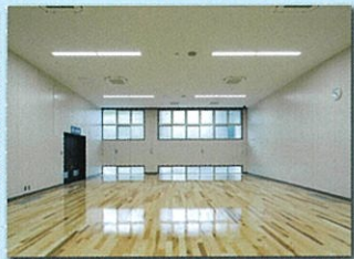
1F 健康体力相談室 (14m×9m) 体操やダンス、ヨガなどの練習で利用できます。