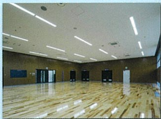
1F 武道室 (14m×18m) 剣道、空手、なぎなた、太極拳などの練習で利用できます。