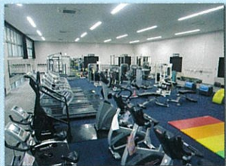
1F トレーニング室 各種の体づくりの器具を備え、楽しく気軽に利用できます。